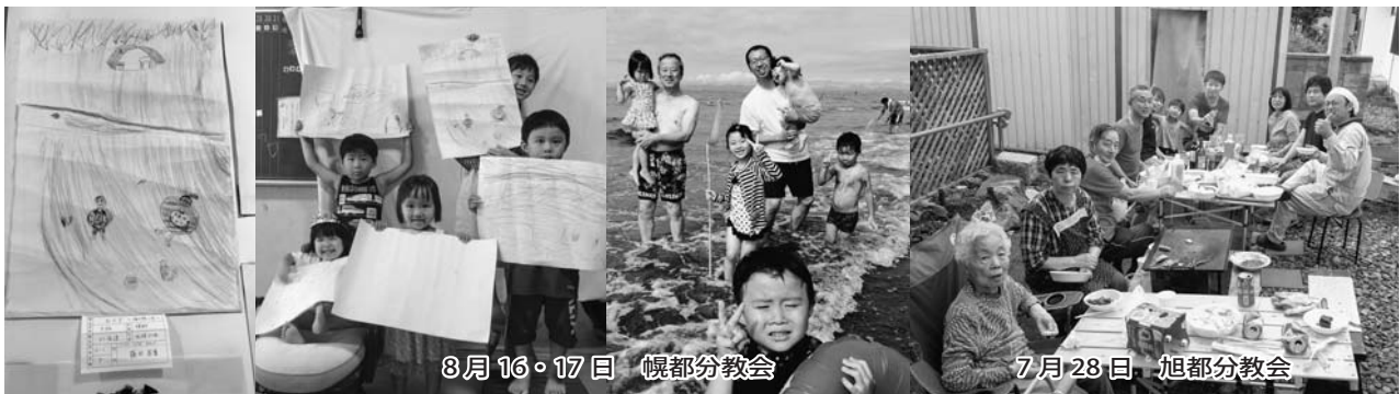
8月16・17日 幌都分教会