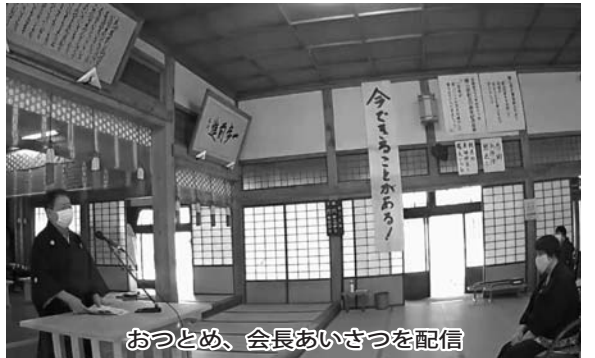
おつとめ、会長あいさつを配信

はこのコロナ禍に揺れる情勢について、今できる事は「人を助ける優しい心を持って、悩み苦しむ人に声を掛け、喜び、感謝の道へと誘う事」であると述べ、それを通してそれぞれが成人の歩を進める事をお誓い申し上げた。