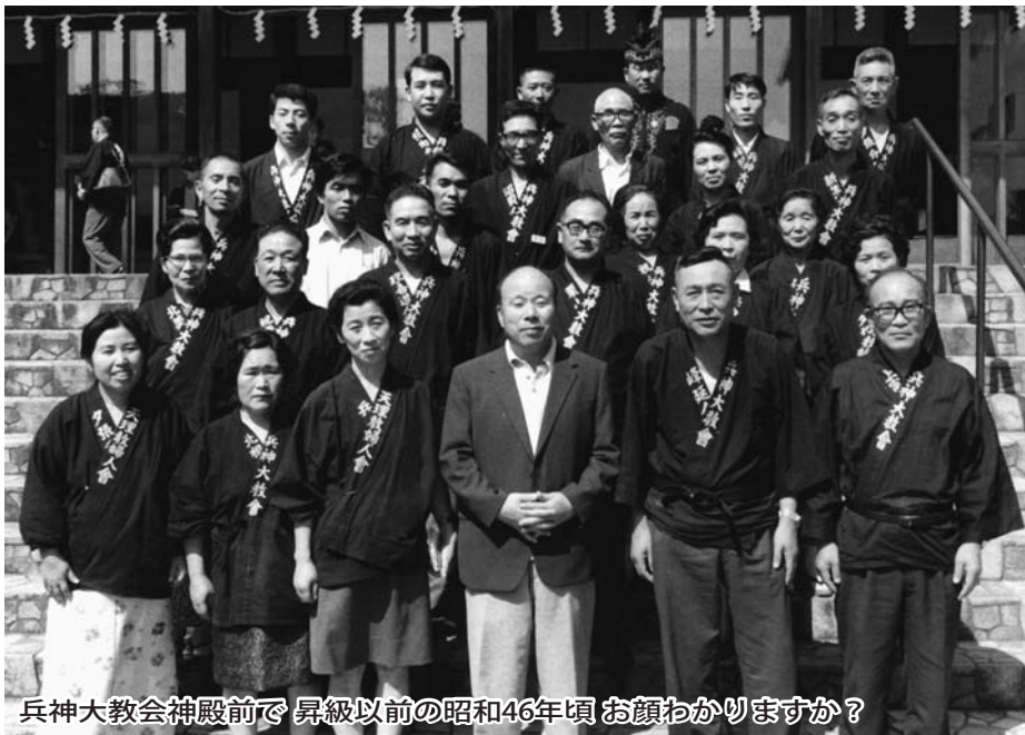
兵神大教会神殿前で昇級以前の昭和46年頃お顔わかりますか？