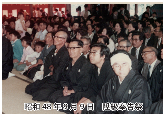
昭和48年9月9日 陸級奉告祭

います」と話された。その後殿内の照明を落として、陸級奉告祭の時の写真をスクリーンにスライドショーで流した。集合写真を大写にして、一人ひとり前会長が解説し、在りし日の先輩達や父母の姿を見て、参拝場からは感嘆の声が多く上がっていた。また、今とは違う、当時の大