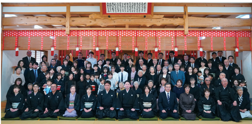
大勢の参拝者を迎え、厳かに奉告祭が勤められた

春風そよぐ5月19日の吉日、善進道分教会にて五代会長就任奉告祭が執り行われた。この日を楽しみに、道内外から多くの信者・教友が集った(写真下)。