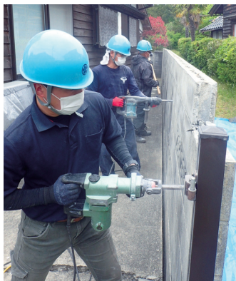
▶委員長講習会の様子(記事3面) ◀災害隊、能登半島地震出動時の様子 【上：現場作業、下：宿舎食事風景】 (記事4面)