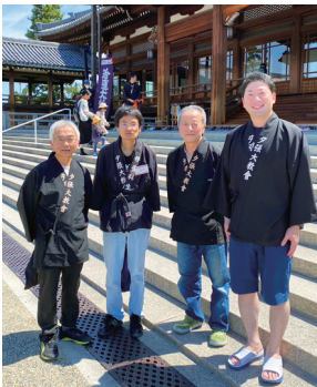
廻廊ひのきしん(5/25、6名参加)