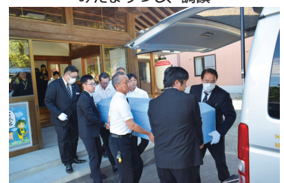
前会長、斎場へ出棺