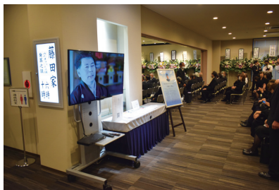
会場では、振り返り映像を上映