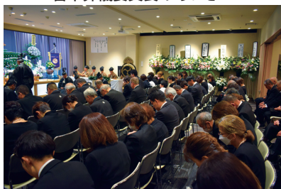
前会長を偲び、涙した