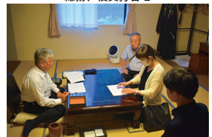
松田先生との打合せ