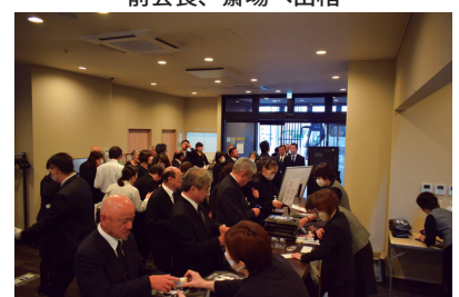
大勢の参列者であふれる