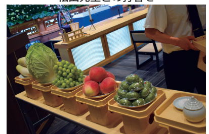
みたまうつき、調饌