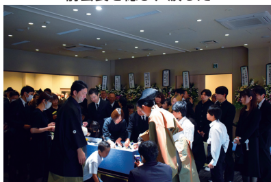
御亡骸との最後のお別れ