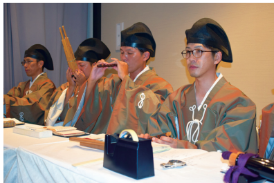
令人（楽人）による奏楽