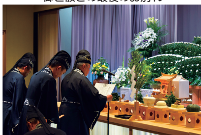
葬後霊祭も厳かにつとめられた