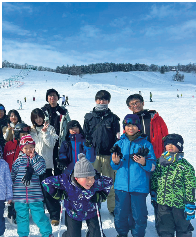
大教会屋根雪下ろし（上写真）、少年会スキー交流会（下写真）。記事はともに 4 頁