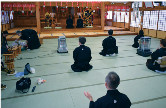
進級進学お願いとめ